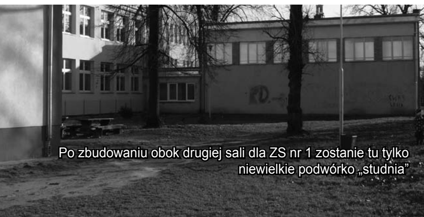
Po zbudowaniu obok drugiej sali dla ZS nr 1 zostanie tu tylko niewielkie podwórkó „studnia”